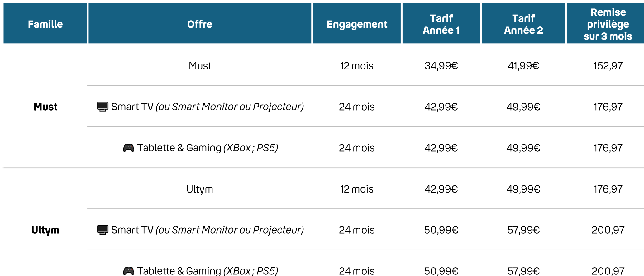
Tableau des offres Bbox éligibles must et ultym, avec déclinaisons Smart TV et Gaming